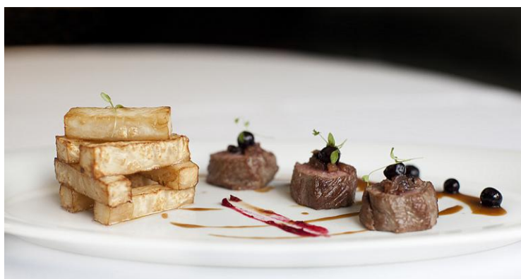
Photo : Noisettes d'agneau au bulbe de céleri rave, jus court aux petits bleuets sauvages du Québec

Au printemps 2011, une belle campagne auprès des médias a aussi été conçue pour inciter le consommateur québécois à intégrer des bleuets sauvages dans son assiette pour Pâques. Le chef réputé Jérôme Ferrer, Grand Chef Relais & Châteaux et copropriétaire des prestigieux restaurants Europea, Beaver Hall, Andiamo et, plus récemment, du Café Birks, a créé trois savoureuses recettes, qui ont reçu un bel accueil dans les journaux, magazines et sites Internet.